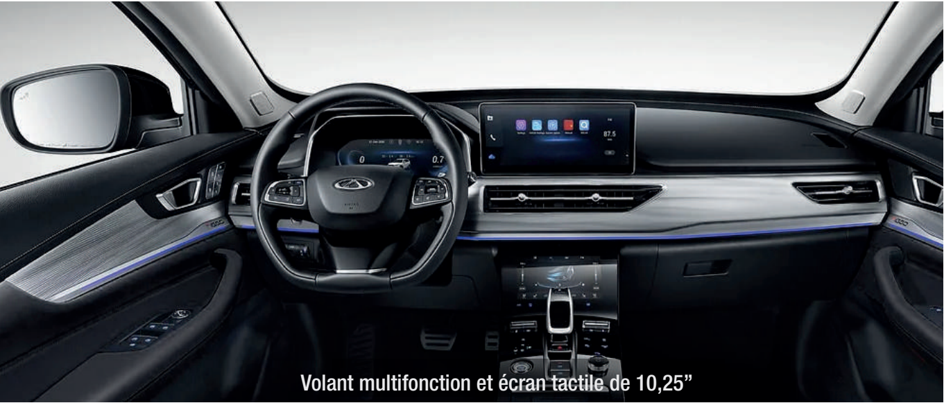
Volant multifonction et écran tactile de 10,25"