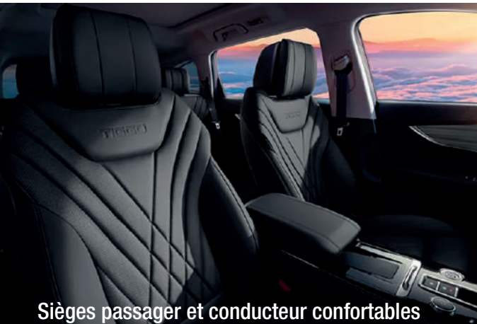
Sièges passager et conducteur confortables