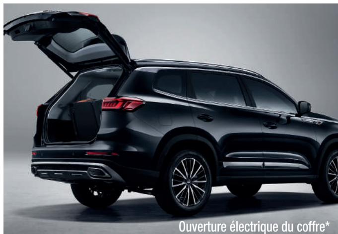
Ouverture électrique du coffre*