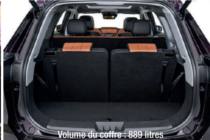
Volume du coffre : 889 litres